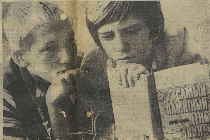
Моя подруга весь вечер проплакала над книгой. Зачем нули такие книги, от которых человек плачет!

Бамовцу никто не напоминает о времени. Здесь каждый исполнит волю своей совести, работает с воодушевлением первых лет после революции. И хотя я не очень люблю громкие слова, но мне хочется закончить свой ответ призывом ко всем: подстрахуйте «Районный наём на БАМЕ». И он чуть было не обидел человека. Хорошо, что мы случайно узнали, что наш собеседник — заместитель начальника стройки и райкома, а значит, «генерал». «Генерал» этот формой,